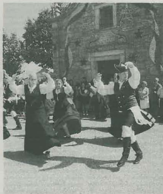
El grupo Virxe do Alívio, en su actuación del año pasado.

A las 19.30, gran caravana automovilística y a las 20.00, tradicional puja de rosas y productos del campo. A continuación, la verbena amenizada por la Orquesta París de Noia, y como broche de oro, la actuación de la cantante gallega Lucía Pérez. ■